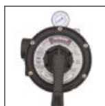
Válvula Vari-Flo™ de 6 posições