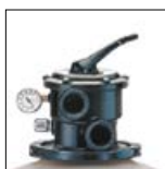
Aréa facilmente acessível graças ao colar de desmontagem