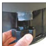
Purgador com tampão de grande dimensão que serve de ferramenta de desmontagem